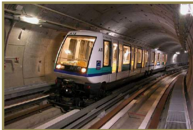
Une rame de la première ligne du métro rennais

20 ans : Plus petite ville de France à en posséder un, Rennes inaugure son métro (automatique), le 15 mars 2002, sur 9,4 km, desservant 15 stations, par rames de 158 places, à 32 km/h. Les travaux ont duré 5 années pour un coût de 527 millions d'euros.