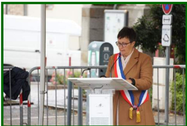
Discours de Mme le Maire