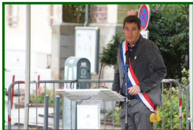
Discours de M. Le Bohec