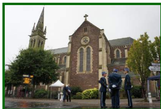
La place inaugurée