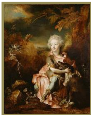
Portrait de Louis, duc de Bretagne, par Nicolas de Largillière

310 ans : Âgé de cinq ans, il n'est dauphin que depuis dix-neuf jours, lorsque Louis, duc de Bretagne, arrière-petit-fils de Louis XIV, meurt de la rougeole, le 8 mars 1712, après ses parents. C'est son jeune frère, le duc d'Anjou (deux ans), qui devient alors dauphin et régnera sous le nom de Louis XV.