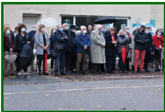
La famille Duché de Bricourt et les élus