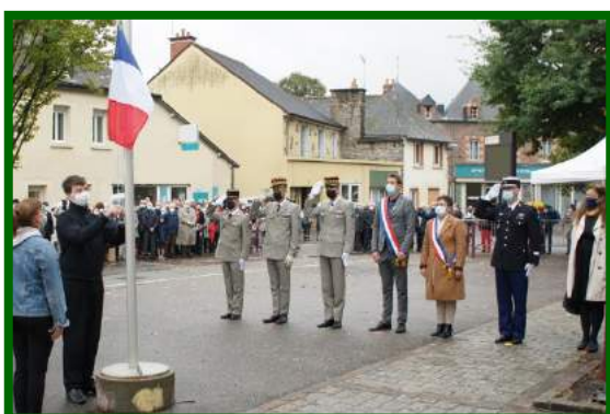
Levé des couleurs