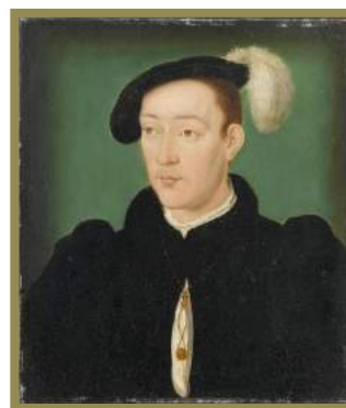
Le dauphin François