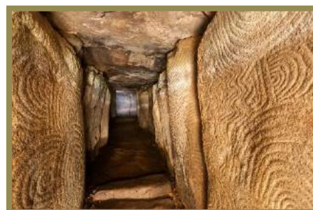
Intérieur du tumulus de Gavrinis

190 ans : Le tumulus de l'île de Gavrinis (golfe du Morbihan), l'un des plus intéressants monuments mégalithiques de Bretagne, est découvert en 1832.