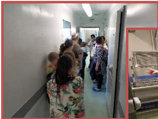
↑ Les chambres froides