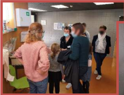
↑→ Accueil des familles