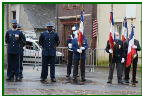
Les portes drapeaux et la délégation de l'Académie militaire de Saint-Cyr Coëtquidan