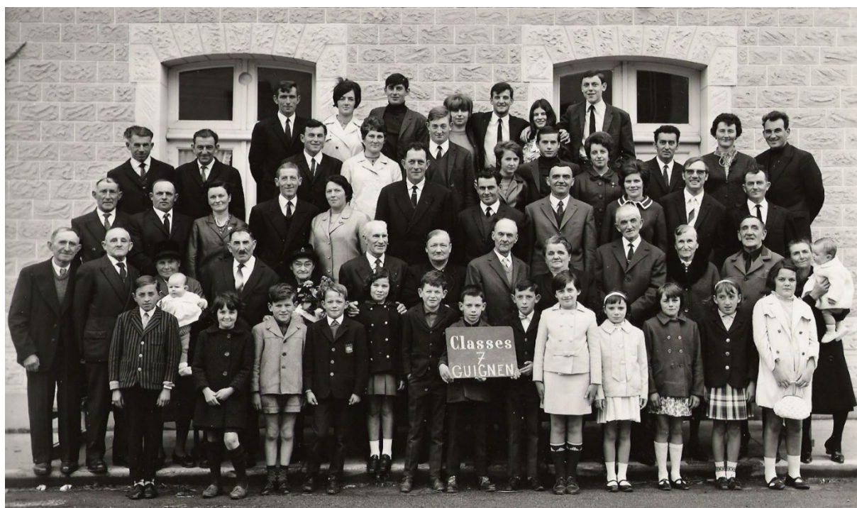
La fête des Classes, en 1967