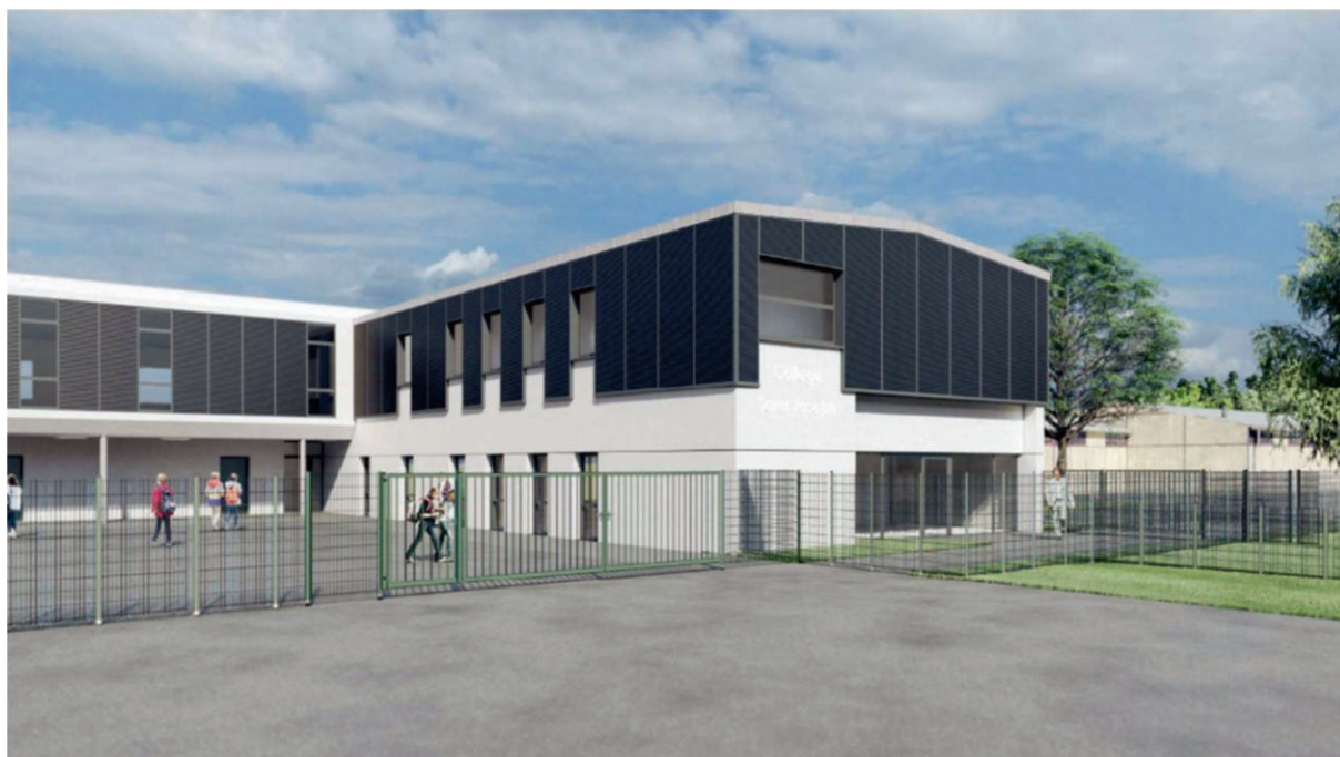
Collège St Joseph, rentrée de septembre 2023