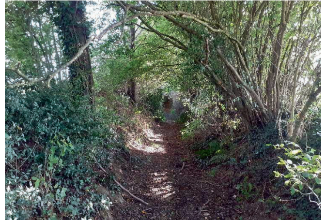
Un chemin creux à la Cheurtière (état actuel)

bourg (!). Mais, signalons aussi que, les amis ayant succédé aux amis et les bolées aux bolées, il pouvait arriver que des plaous compatissants aient à le hisser dans sa charrette, où aussitôt il s'endormait comme un bébé. Quelqu'un donnait alors une petite tape sur la croupe de la jument, et hop ! comprenant bien qu'elle avait désormais charge d'âme, la bête assurait de mémoire le rapatriement sanitaire du patron vers la maison.